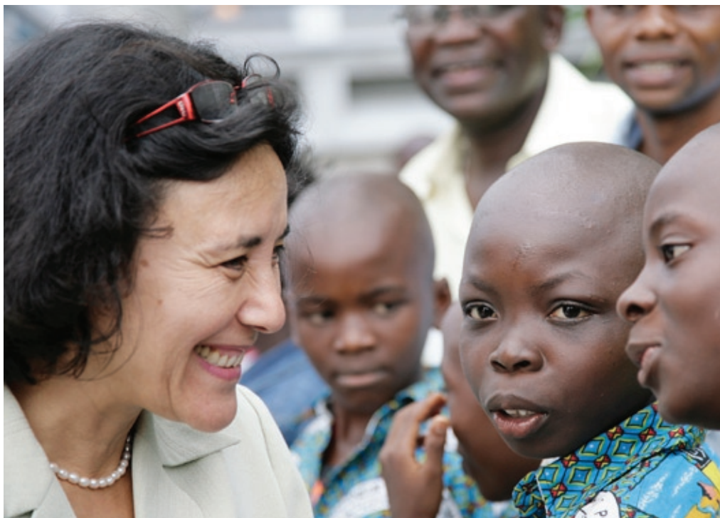
Durant son mandat, Leila Zerrougui a écouté les enfants congolais et défendu leurs droits.

civiles. Un autre événement majeur, les attaques perpétrés par la LRA (Armée de résistance du Seigneur, ndlr) tout le long de l'année 2008 et notamment un massacre perpétré en pleine fête de Noël ciblant les populations des territoires de Faradje, Dungu et d'autres localités du Haut Uélé.