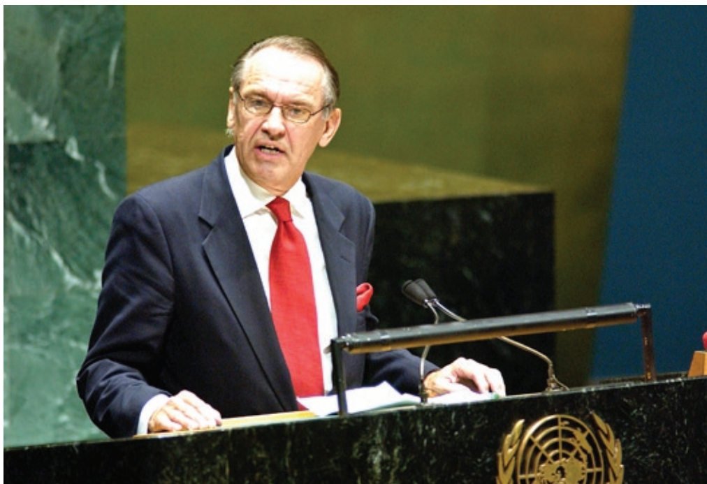
Jan Eliasson, Vice-Secrétaire général de l'ONU

l'ONU a avoué ne pas savoir quelle forme prendrait un tel mécanisme qui pourrait provenir de la Mission de l'ONU en RDC (MONUSCO), d'autres forces des Nations Unies ou de l'Union africaine. “Nous verrons, mais le plus important est que les deux pays aient accepté le principe” , a-t-il commenté, lors de la présentation de ses priorités à la presse.