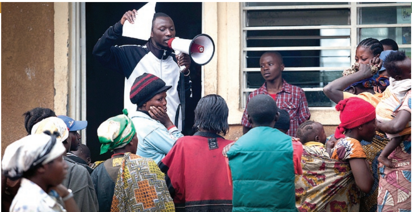
Un groupe de femmes déplacées internes à Kanyarutshinya