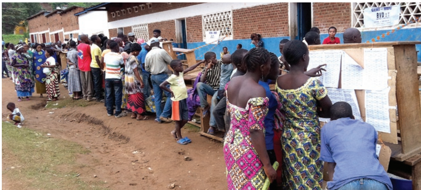
Comme en novembre 2011, la MONUSCO entend appuyer les élections provinciales et locales en RDC. Ici à Uvira, le jour des votes présidentiel et législatif, le 28/11/2011)

Lire à la page suivante l'explication du directeur de la division électorale de la MONUSCO