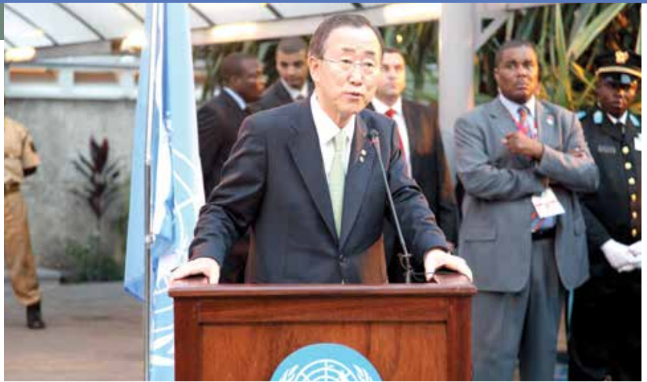
Le Secrétaire général des Nations Unies, Ban Ki-moon, ici en visite en RDC le 30 juin 2012, plaide sans coup férir pour une paix durable, un développement durable et un avenir durable dans le monde

Rétrospective sur la journée internationale de la paix, le 21 septembre