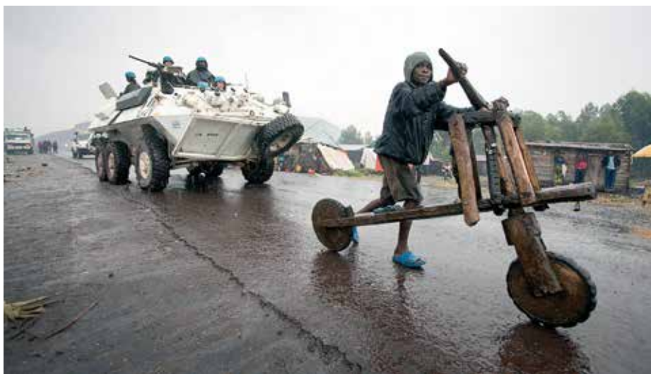
Scène de rue à Bukavu, Sud Kivu - Photo MONUSCO/Sylvain Liechti

✂ Par Tahina Garcia Andriamamonjitanasoa/MONUSCO