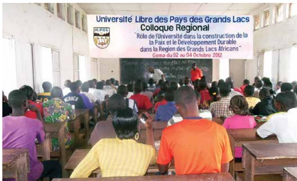
Des étudiants, à Goma, lors d'un colloque régional sur la paix et le développement, à l'Université Libre des Grands Lacs

A l'issue de ce colloque, les participants se sont engagés à : assainir les milieux universitaires en inculquant des valeurs civiques aux étudiants et ainsi, aider à créer d'honnêtes citoyens fiers de servir leur pays ; promouvoir la culture de la paix par l'introduction de la paix dans les curriculums universitaires ; et créer un réseau interuniversitaire dans la sous-région en vue d'entreprendre des recherches dans des domaines d'intérêt commun et faire des publications tendant à promouvoir la paix et le développement durable ■