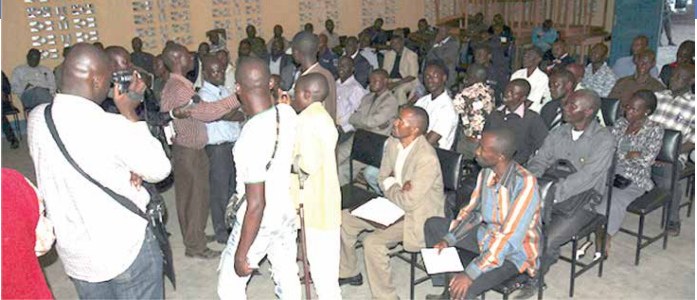
Des participants à une manifestation foraine organisée du 28 au 29 septembre 2012 - Photo MONUSCO/Laurent Sam Oussou

dégénère en une guerre interethnique aux conséquences démesurées, la MONUSCO a organisé du 8 au 10 août 2012, dans la plaine de la Ruzizi, une mission conduite par une Equipe de protection conjointe composée des sections Affaires civiles, Droits de l'Homme, Protection de l'Enfant, DDRRR (Désarmement, Démobilisation, Rapatriement, Réinstallation et Réinsertion), ainsi que de la Police MONUSCO, et de la Brigade du Sud Kivu. Des contacts formels et informels furent entrepris avec les différentes communautés impliquées dans ce conflit. A la même période, la Force de la MONUSCO conduisait des patrouilles régulières sur les principales voies de communication en vue de dissuader toutes tentatives d'affrontement.