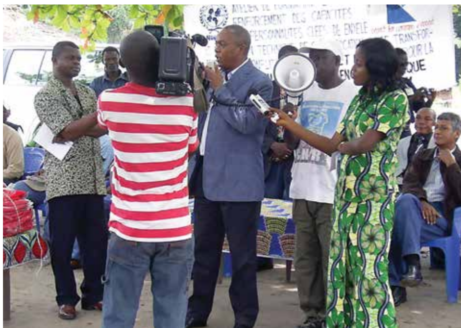
La MONUSCO, les autorités locales, y compris la presse, tous au service de la paix dans la province de l'Equateur

Dans les villages de Gemena à Budjala, en passant par Yakoma, Enyele, Munzaya, Bozene ou Bokonzi, les conflits les plus récurrents demeurent ceux qui sont liés à la terre ou au contrôle du pouvoir coutumier. Ces populations n'hésitent pas à recourir aux armes blanches et autres de fabrication artisanale, pour en découdre. Les années 2009 et 2010 furent particulièrement marquées par la révolte du Mouvement de Libération des Indépendants et Alliés