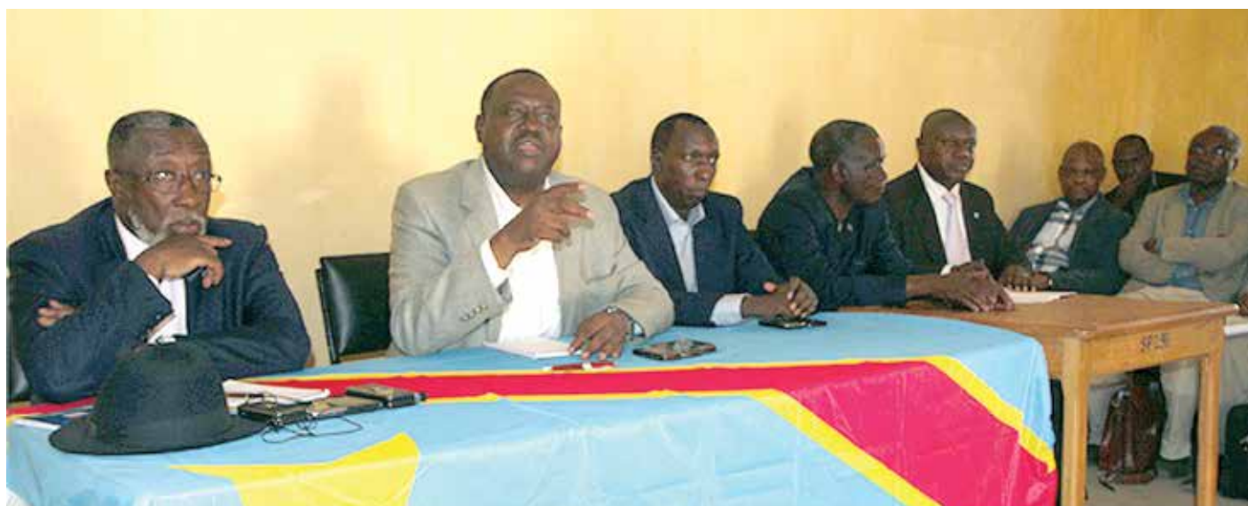
Le gouverneur de la province du Sud Kivu, Marcellin Cissambo (g), avec à sa gauche le Ministre de l'Intérieur Richard Muyej, dans une réunion avec les notables de Ruzizi

Dans la plaine de la Ruzizi cohabitent deux communautés, les Bafuliru et les Barundi. Cette collectivité est frontalière avec celle des Bavira. L'Etat congolais a hérité de l'Etat colonial belge le découpage cartographique de ces trois chefferies qui forment aujourd'hui le territoire d'Uvira sous le décret-loi royal du 04/10/1928.