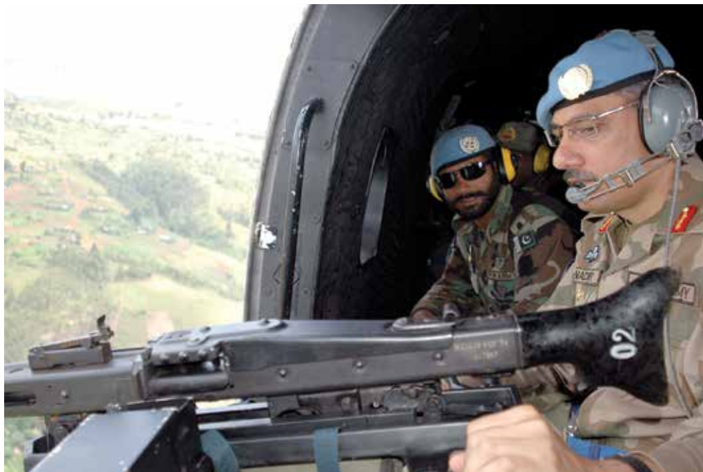
Le Général Nadir Khan, Commandant de la Brigade du Sud Kivu à bord d'un hélicoptère lors d'une opération militaire dans la province

La Mission de l'Organisation des Nations Unies pour la Stabilisation en République du Congo (MONUSCO), en appui aux autorités provinciales et nationales, a participé à quelques réunions de médiation avec un certain nombre de communautés locales. Dans un contexte d'efforts conjugués de la MONUSCO et des autorités locales visant à régler le conflit qui oppose depuis longtemps les communautés Bafuliro et Barundi dans la Plaine de la Ruzizi, le Général de Brigade Nadir Khan, Commandant de la Brigade du Sud-Kivu a saisi cette occasion pour évoquer les efforts de médiation déployés par la MONUSCO au Sud-Kivu.