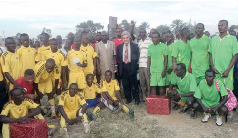
Des rencontres culturelles, dont un match de football amical entre les jeunes, ont été organisées

A Bunia, comme dans le reste des territoires de la République démocratique du Congo, la Journée internationale de la paix a été célébrée, le 21 septembre 2012.