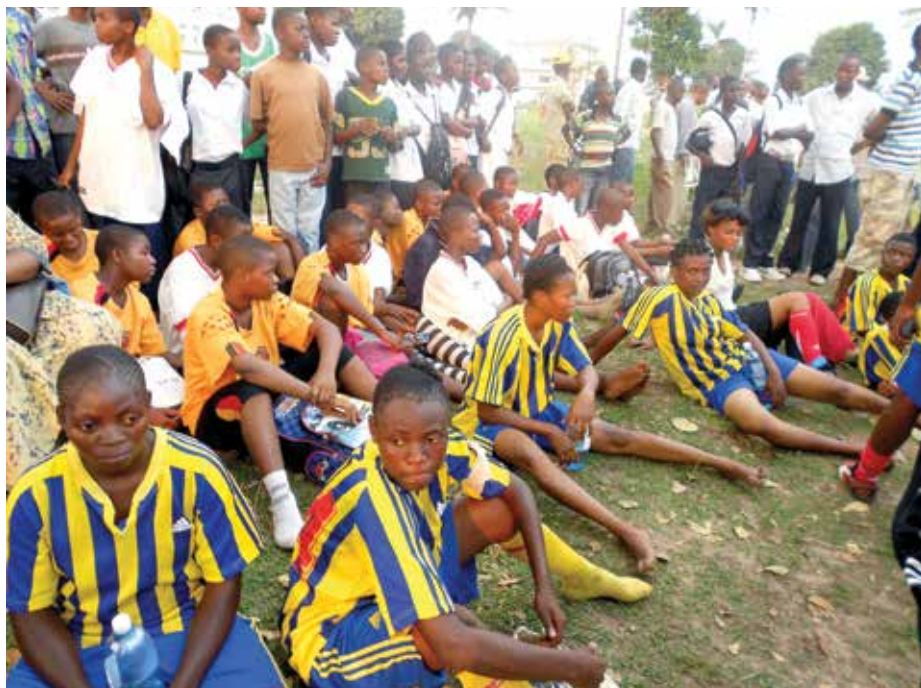
Un groupe de jeunes filles et garçons des villages de Bungamba, après un match de football amical, signe de rétablissement de la paix sociale

formation en gestion et transformation des conflits a été organisée à l'intention de 40 leaders locaux, notamment des chefs de groupements, des chefs de localité, des notables dont quatre femmes. Suite à cet atelier, les participants ont signé "un acte d'engagement" pour le rétablissement définitif de la paix sociale entre les différentes communautés et un comité local de réconciliation composé de 10 membres a été mis en place pour veiller