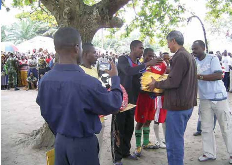
Une séance de sensibilisation à la culture de la paix, à travers le sport-roi, le football, entre les jeunes

Ensuite, à Dongo, du 18 au 25 août 2010, 38 personnes avaient été formées