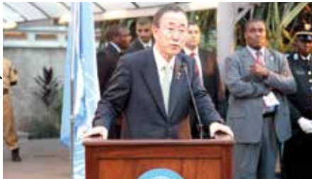
Le Secrétaire général des Nations Unies, Ban Ki-moon