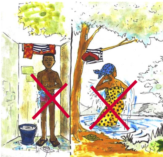
Kosokola nzoto te nsima ya bosibi na makasi wana.