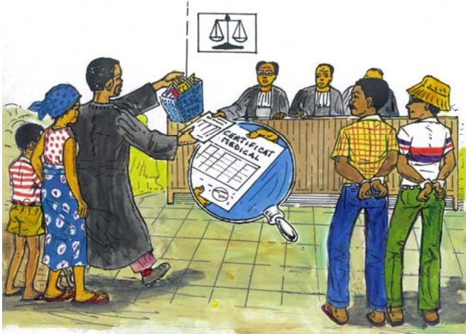
Tribinali ekokata likambo mpe ekoki kologisa yo.