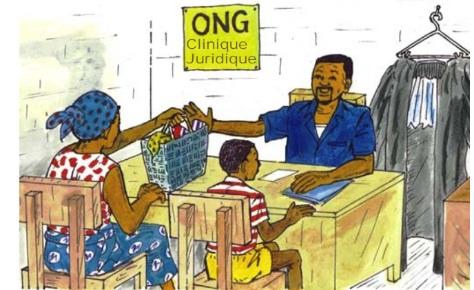
Kende komona ONG moko oyo ekopesaka lisalisi na maye matali bosambisi to ONG oyo ekotalaka makoki ya moto. .