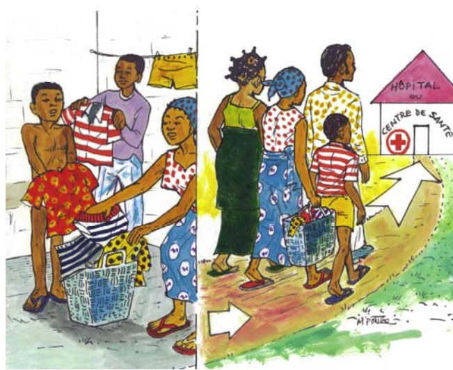
Bomba bilamba oyo olataki ntango ya likambo lyango.