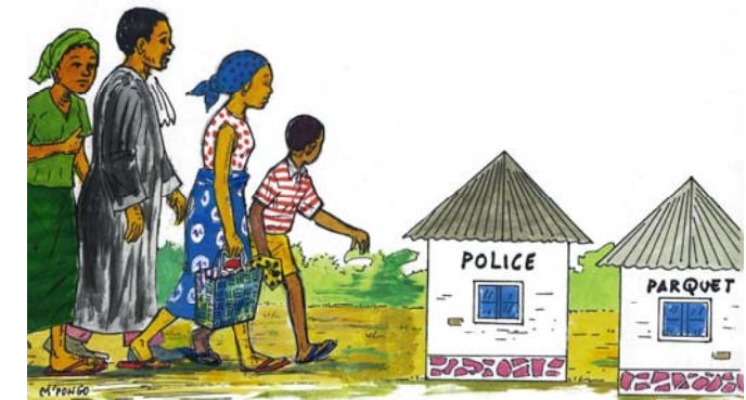
Funda likambo lyango na lombango nyonso.