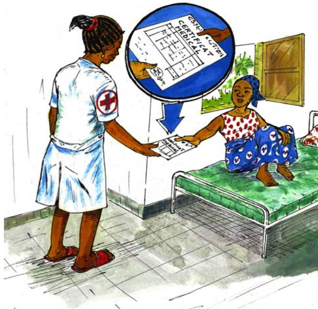
Kende na lombango na lopitalo ya pembeni mpo na lisalisi mpe mpo na kosalisa setifika oyo elakisi bolali na makasi. Okoki kozua elendisi ya monganga ya makambo matali moto na ndako ya boyoki.