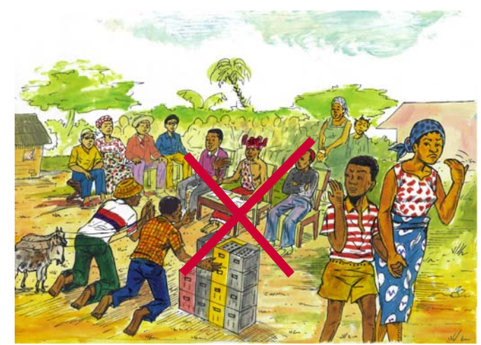
Boya kobongisa likambo yango na ndenge ya bondeko.