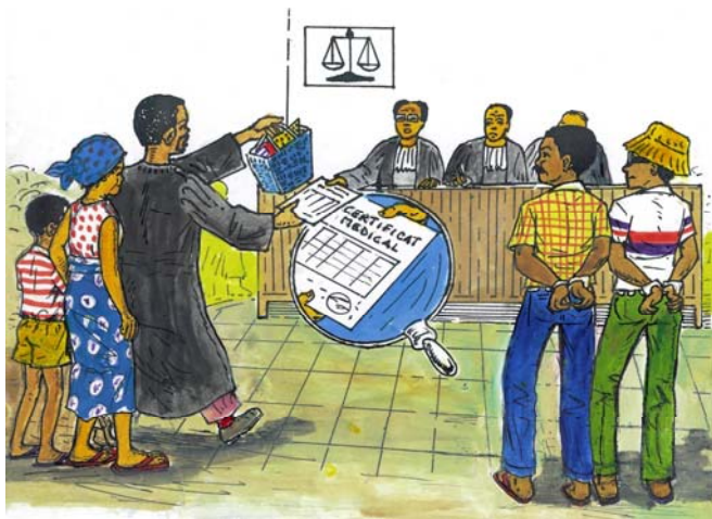
Le tribunal peut vous rendre justice.